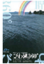
1999年 第四回BDCA『My Work』展(びわこ360°)