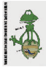
2001年 第9回世界湖沼会議関連事業及び湖国21世紀記念事業