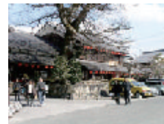
2006年 第2回(BDCA塾) お菓子の「たねや」さん