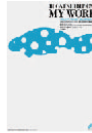
1997年 第二回/BDCA会員『My Work』展