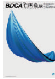
1996年 第一回/BDCA会員『自画像』展