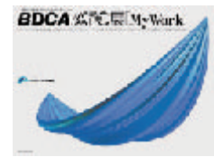
2000年 BDCA/ATC展/『My Work』大阪