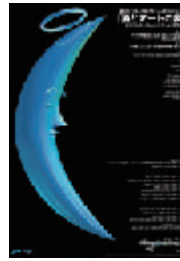
1998年 第三回/BDCA会員展 + BDCA『酒とアートの宴』