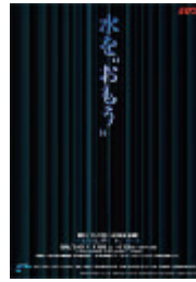
2001年 第五回BDCA会員展『水を"おもう"』