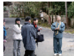
2006年 第1回(BDCA塾) 三井寺の国宝(建築と美術)そして 大津歴史博物館(歌川広重の近江八景)