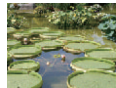
2006年 第4回(BDCA塾) 水生植物園で"ねむる蓮"睡蓮を写真家木村尚達さんと撮る・観る・語る