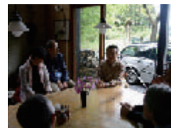
2006年 第3回(BDCA塾) 写真家今森光彦さんのアトリエをたずねて